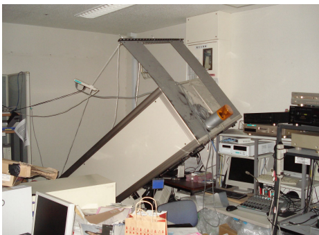
fmいずみは震災で被災。 翌日から区役所に臨時スタジオを開設し放送した

東日本大震災が発生した2011年3月11日は、夕方から深夜1時まで NHKラジオ第一に出演し、防災士として被災者へ共助を呼びかけた。fmいずみでは、防災キャスターとして地域の細かな災害情報を発信。甚大な被害を受けた出身地でもある石巻市をはじめ、被災地の取材にも精力的にあたっている。国立仙台高等専門学校参与、東北福祉大学兼任講師、仙台市社会教育委員、社会貢献学会理事、仙台市教育委員会理科特別講師。日本 PTA全国協議会階調表彰。平成23年度放送記念日で NHK表彰。