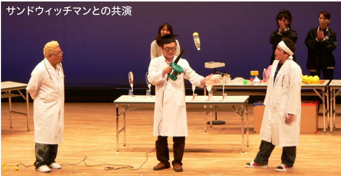
サンドウィッチマンとの共演