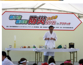
防災エンスショーが報道で取り上げられ拡がり、全国各地へ外向き講演を展開。 東日本大震災の実体験を語り、子供から大人まで幅広い層へメッセージを送る