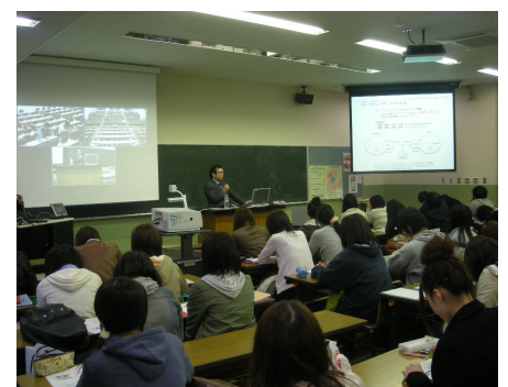
大学で防災と情報に関する講義を担当