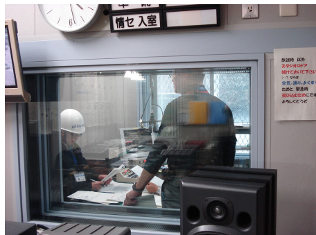
震災当日(3/11) NHKスタジオにて